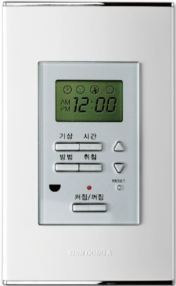
※ 모델에 따라 제품의관이 다소 다를 수 있습니다.