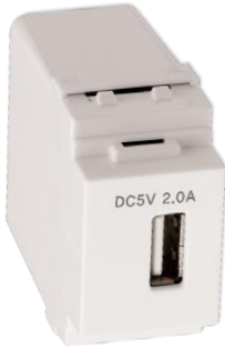
세로형으로 부착 시