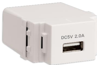
가로형으로 부착 시